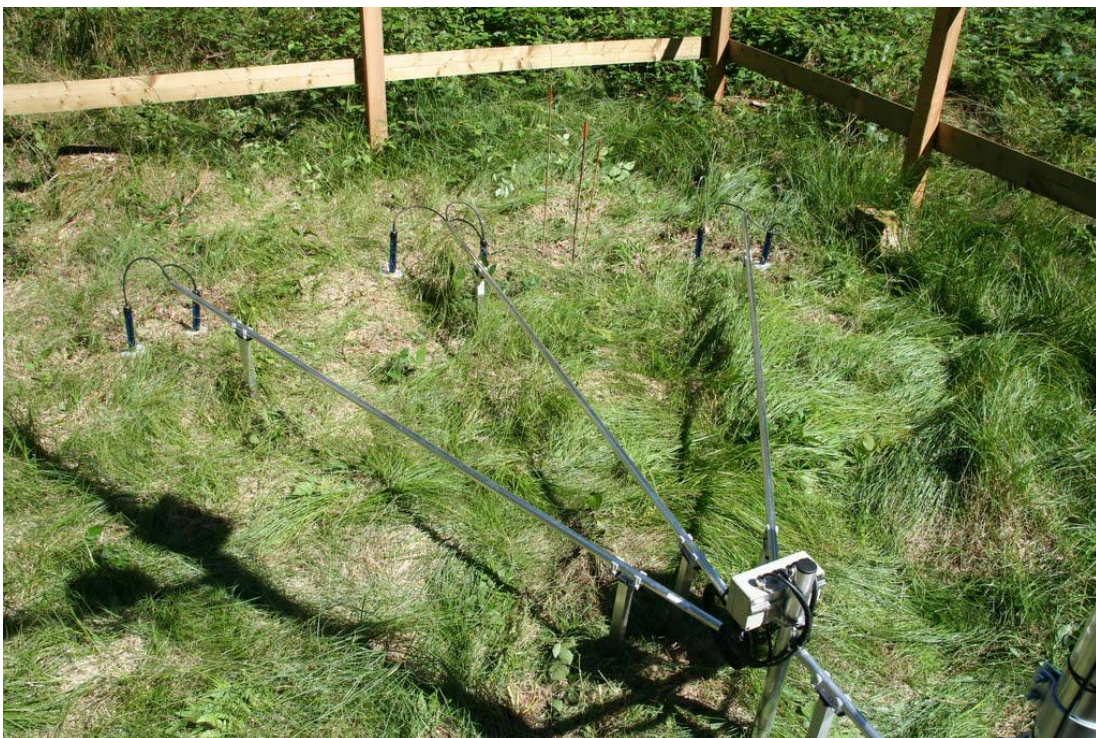
Übersicht der Tensiometer, noch ohne Schutzumhüllung