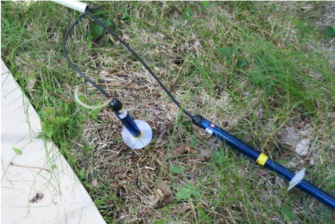
Tensiometer während dem Einbau