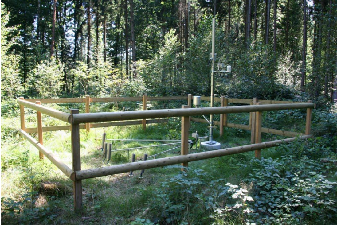
Gesamtansicht der Station