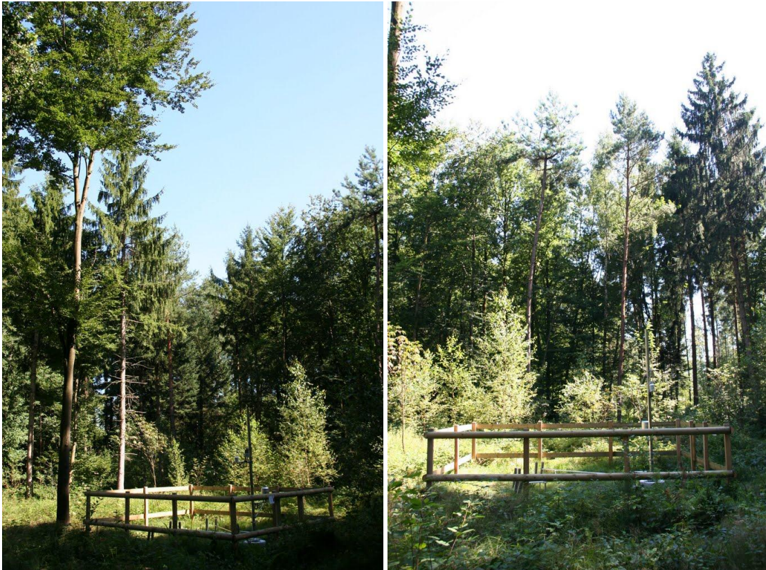
Die Station befindet sich in einer grösseren Waldlichtung.