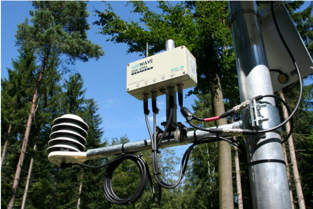
GPRS-Sender und Vaisala-Sonde zur Messung der Lufttemperatur und Luftfeuchtigkeit.